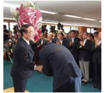
苦しい場面で支えていただいて感謝。職員一同を代表して花と寄せ書きが贈られる。