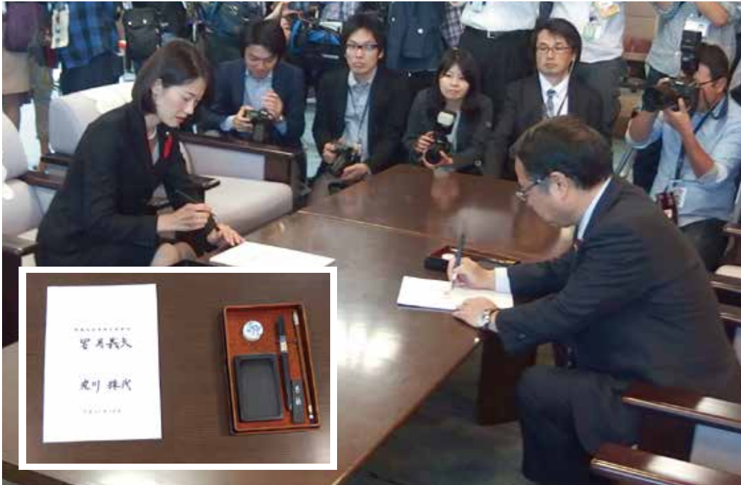
環境大臣・事務引継式の模様 丸川新大臣へバトンタッチ